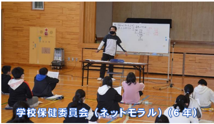
学校保健委員会（ネットモラル）（6年）