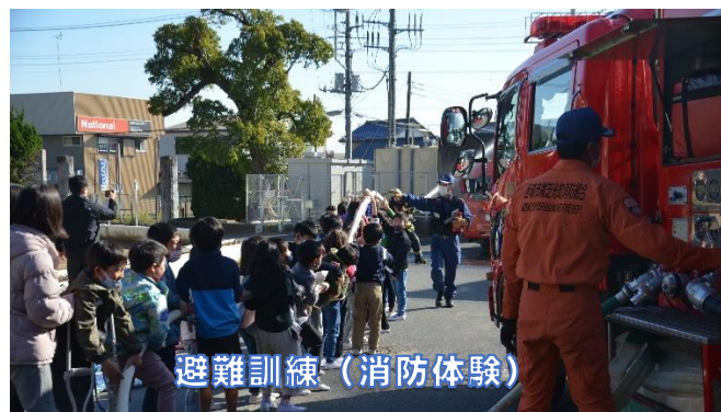
避難訓練 (消防体験)