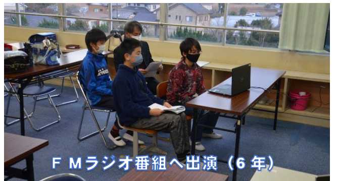
F Mラジオ番組へ出演（6年）