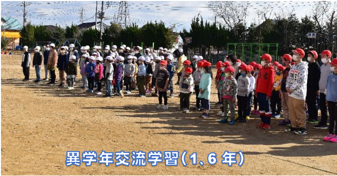
異学年交流学習（1、6年）