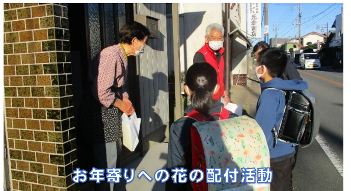
お年寄りへの花の配達活動